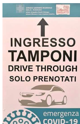
Segnaletica "Drive Through"